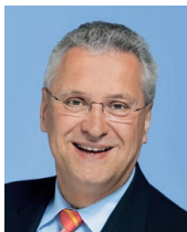
Joachim Herrmann Staatsminister